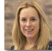
Eva De Bleeker Gemeenteraadslid & Staatssecretaris van Begroting en Consu- mentenzaken